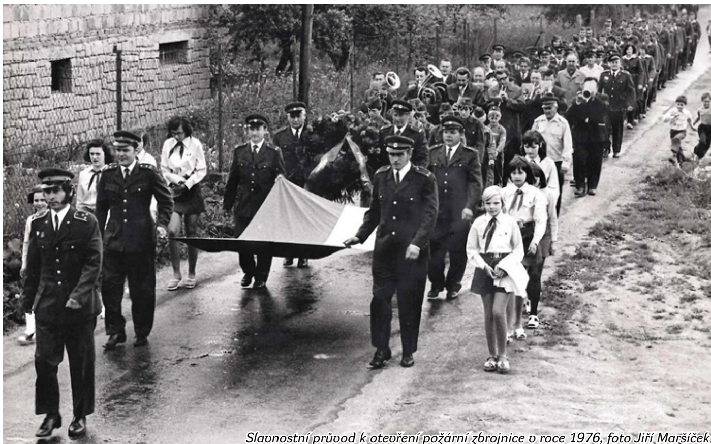
Slavnostní průvod k otevření požární zbrojnice v roce 1976