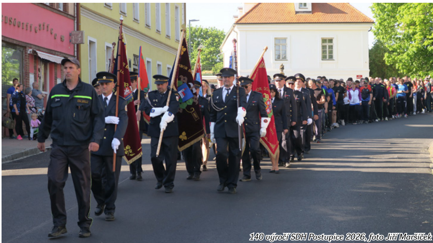
140 výročí SDH Postupice 2026

Postupický zpravodaj je občasníkem obecního úřadu v Postupicích, vychází 4x ročně, distribuce je zajištěna zdarma do všech domácností na Postupicku. Číslo 92 vyšlo 10.ČERVNA 2026 v Postupicích • Redakční rada: Jaroslav Andr (starostapostupice@chopos.cz), Jana Jiřová (jana.jisova@zspostupice.cz), Eva Procházková (eožaneta@seznam.cz), Jiří Maršíček (jmarsicek@seznam.cz), Anna Pütová (putoaa@chopos.cz) • Grafické zpracování / layout: Jiří Malý (jiri.d.maly@seznam.cz)