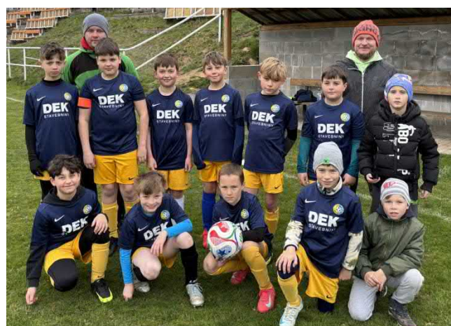
Starší příprava před domácím utkáním

Starší příprava byla vzhledem k vydařené podzimní sezóně pro jarní část nalosována do skupiny s top týmy okresu, což je znát na výsledcích, ale o radost z výhry naši nakonec ochuzeni nebyli.