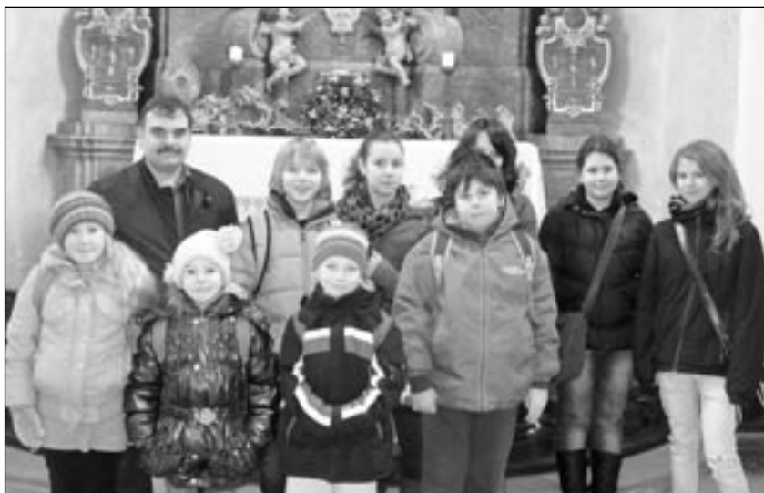
Den ředitelky na zámku Jemniště

23. března 2013 se v Postupicích koná tradiční Velikonoční jarmark, který pořádá RC Kostičky ve spolupráci s Obcí Postupice. Stejně jako v předešlých letech zde bude mít dva