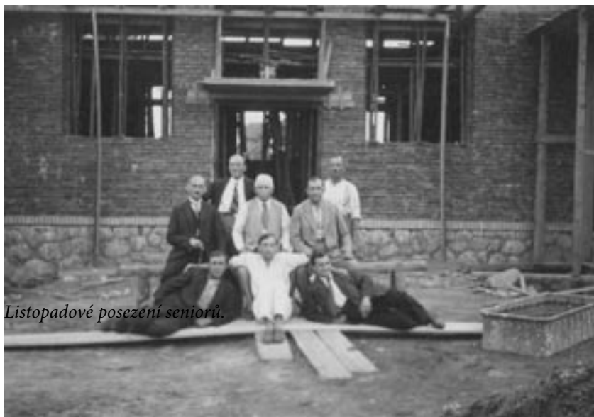
Listopadové posezení seniorů.

Toto byl návrh stavitele Neubaera z Vlašimi na novou sokolovnu v Postupicích. Žel, že se nám tehdy nepodařilo tento návrh prosadit. I zde rozhodovaly osobní zájmy, osobní nevraživost a u mnoha nezáměr. Postavila se s odpuštěním budova naprosto nevyhovující, jak se brzo ukázalo, ale bylo už pozdě, napsal bývalý člen výboru Sokola. Škoda, mohla zde stát krásná funkcionalistická stavba, která by byla architektonickým skvostem a ozdobou Postupic.