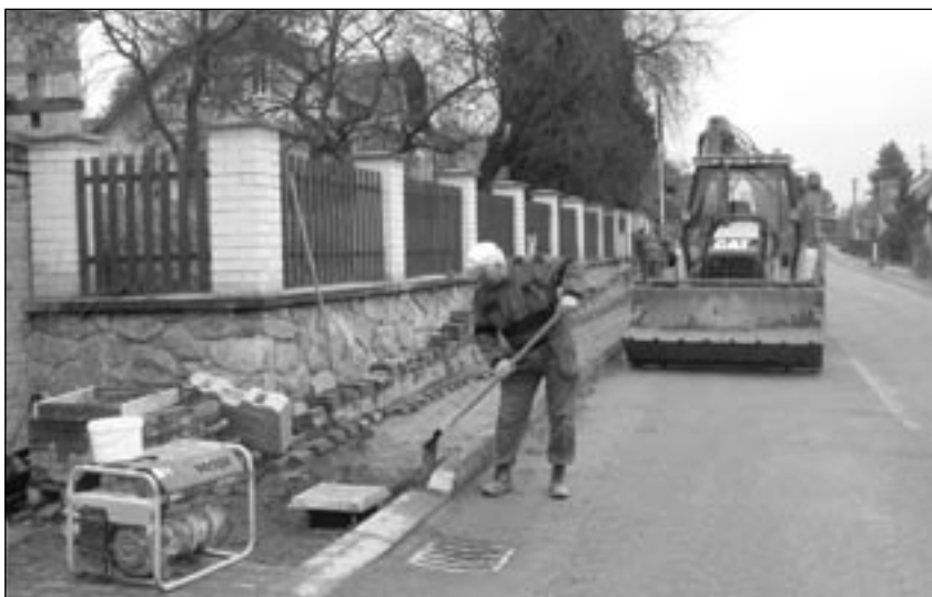
Rekonstrukce kanalizace v Postupicích.