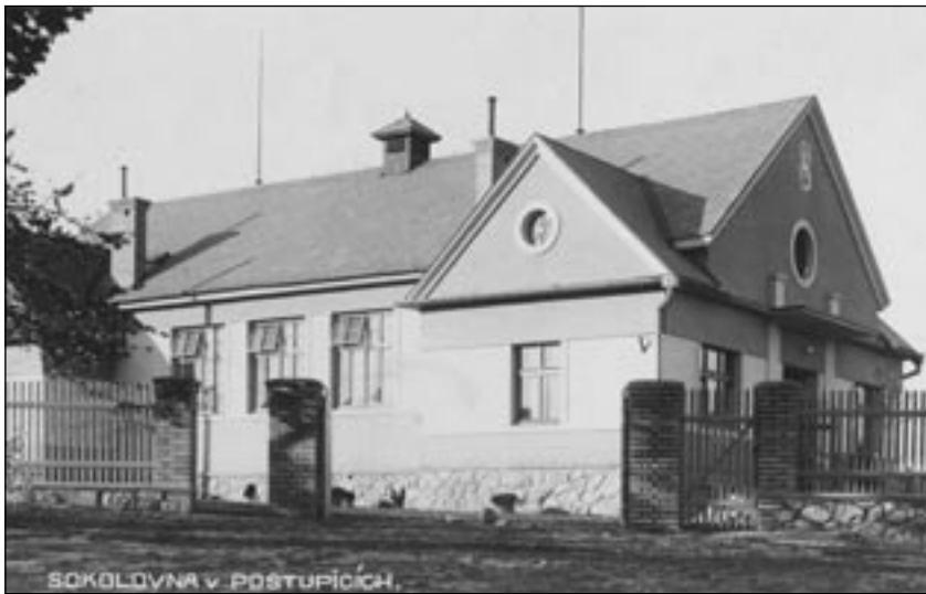
Pohlednice z roku 1933, která byla vydána na paměť slavnostního otevření nové sokolovny.

Při letošní výroční schůzi Sokola v místní sokolovně, která byla před osmdesáti lety v roce 1933 slavnostně otevřena, mě napadlo z dochovaných záznamů vám přiblížit vznik Sokola, přípravy a stavbu sokolovny.