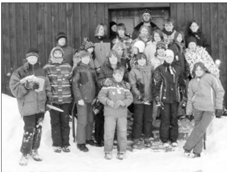
Žáci 7. a 8. třídy na lyžařském výcvikovém kurzu v Bedřichově.

Když byste přišli ve středu 26. 1. do budovy školy v Postupicích, potkali byste krásnou princeznu, zlou královnu s otráveným jablkem, trpaslíka nebo vílu Amálku. Starší školáci tak vítali budoucí prvňáčky. Ti přicházeli plni napětí a očekávání. Ve své budoucí třídě ukázali paním učitelkám, co všechno umí. Celým zápisem je provázela Sněhurka. A tak počítali trpaslíky, říkali, kde stojí, jakou barvu čepičky mají, co všechno si schovali pod velký šátek. Také předvedli, jakou se naučili básničku nebo písničku nebo jaký mají smysl pro rytmus. Rodiče se zatím dozvěděli užitečné informace. Všech budoucích 15 prvňáčků si odneslo drobné dárky. Od začátku března