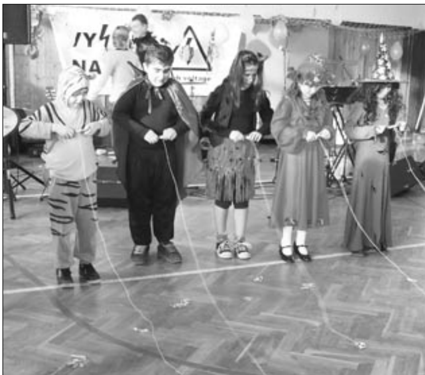
Dětský karneval v tělocvičně základní školy v Postupicích.