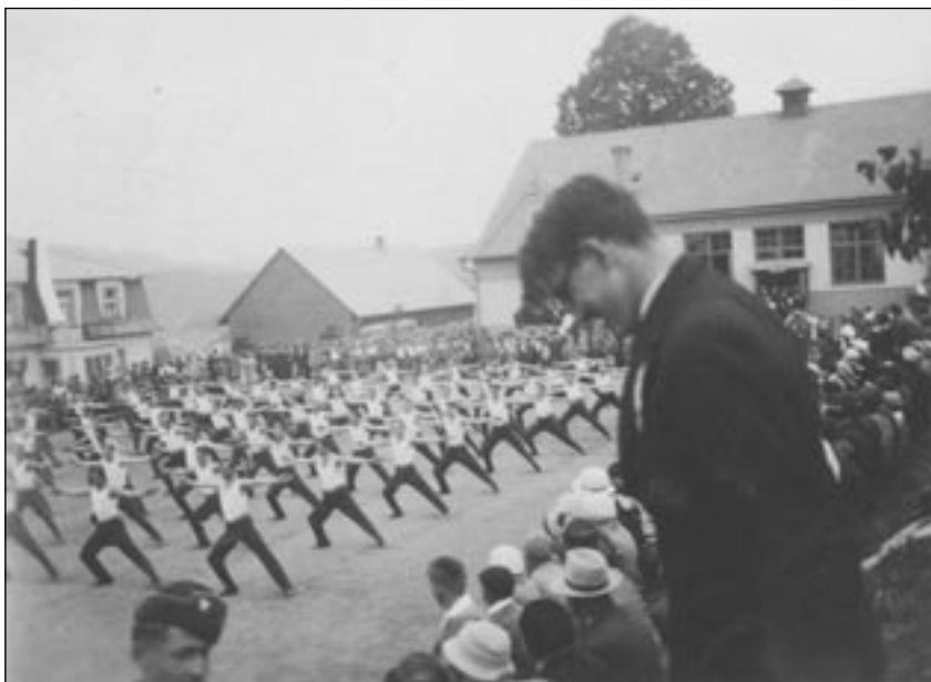
Na oslavu narozenin pana prezidenta T.G.Masaryka byla uspořádána 12. března 1933 tělocvičná akademie, při níž cvičili žáci a žačky, muži i ženy.

V dubnovém čísle Zpravodaje jsem přiblížil vznik Sokola a průběh stavby sokolovny s tím, že v příštím čísle přiblížím další osudy této stavby až do dnešní doby. Myšlenka dobrá, ale po přečtení všech dostupných dokumentů, kdy sokolovna s velkým sálem byla jediným kulturním a společenským stánkem v Postupicích, její historie trvání osmdesát let by vydala na celou knihu.